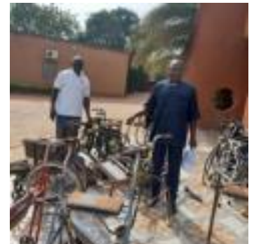
Livraison du matériel 1